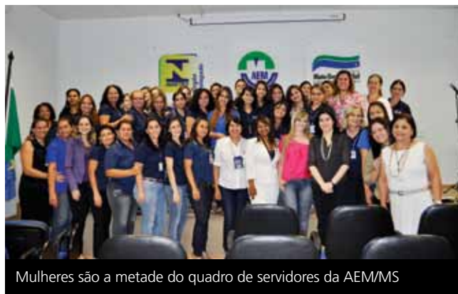
Mulheres são a metade do quadro de servidores da AEM/MS