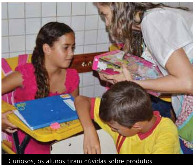
Curiosos, os alunos tiram dúvidas sobre produtos