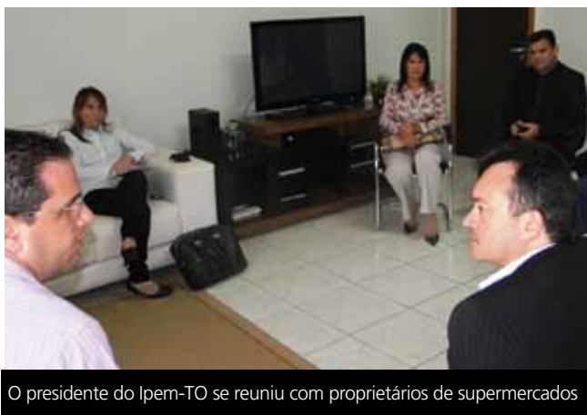
O presidente do Ipem-TO se reuniu com proprietários de supermercados

A missão do Instituto de Pesos e Medidas do Tocantins (Ipem-TO) é prover para o consumidor confiança nas medições e na qualidade dos produtos e serviços disponibilizados no mercado, por meio da metrologia ou da avaliação da conformidade, assegurando equilíbrio na relação de consumo.